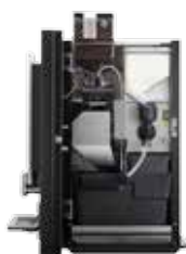
OPTIBEAN 2 (XL) TOUCH