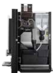
OPTIBEAN 3 (XL) TOUCH